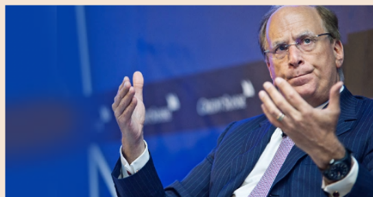
Larry Fink